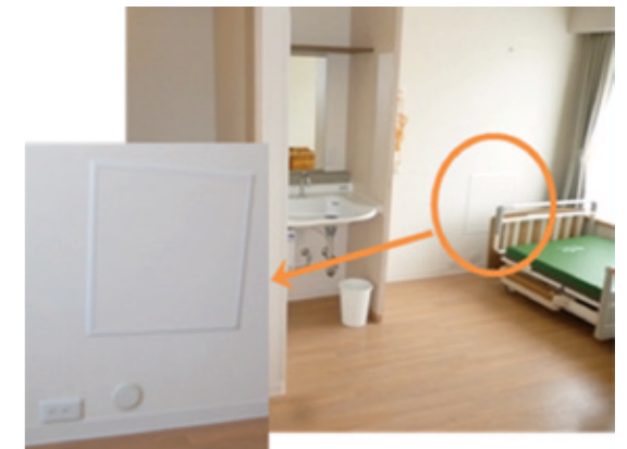
将来のベッドサイド水洗トイレを想定した プレ給排水管(壁内に隠す)