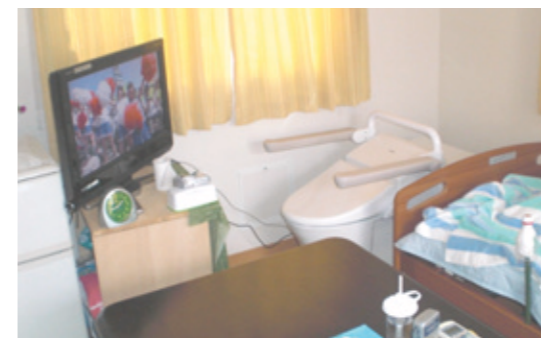
在宅介護現場での設置事例