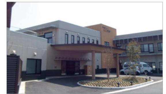
特別養護老人ホーム「ここのか」外観